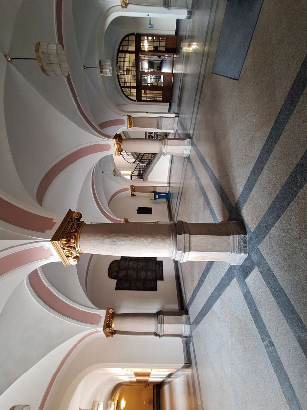
WIDOK NA HOL WEJŚCIOWY ORAZ ISTNIEJĄCE TABLICE PAMIĘCI PRACOWNIKÓW UNIWERSYTETU POZNAŃSKIEGO ORAZ PAMIĘCI KRYPTOLOGÓW.