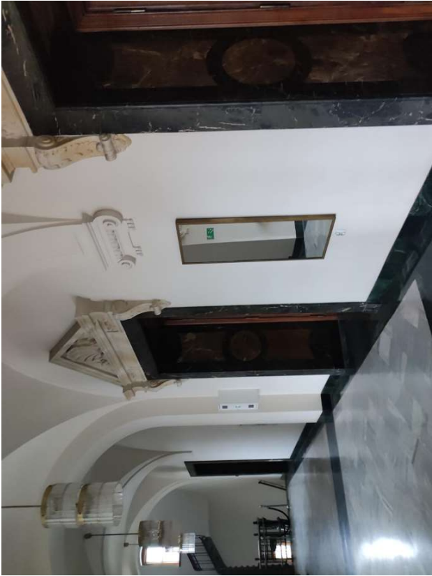
WIDOK NA AULĘ UNIWERSYTECKĄ.

Niniejsze opracowanie chronione jest prawem autorskim (Ustawa z dnia 4 Maja 1994 Dz. U. z 2000 r. Nr 80, poz. 504) Nie może być kopiowane, ani udostępniane bez zgody projektantów.