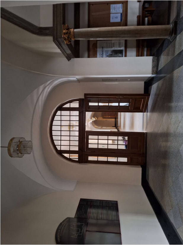
WIDOK NA WNEKĘ ZA SCHODAMI ORAZ ISTNIEJĄCĄ TABLICĘ Z PLANEM BUDYNKU.